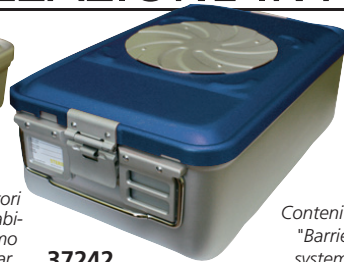
Contenitori "Barrier system"