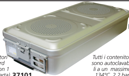
Tutti i contenitori sono autoclavabili a un massimo 134°C, 2,2 bar