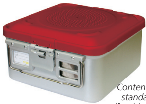
Contenitori standard (forniti con 1 filtro in carta) 37101