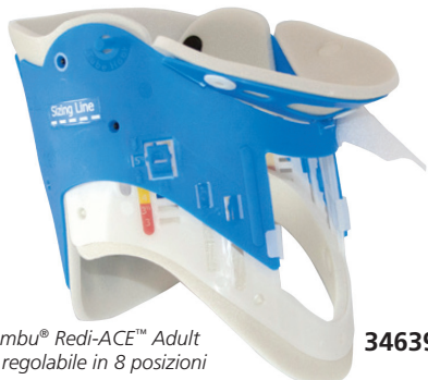
Ambu® Redi-ACE™ Adult è regolabile in 8 posizioni