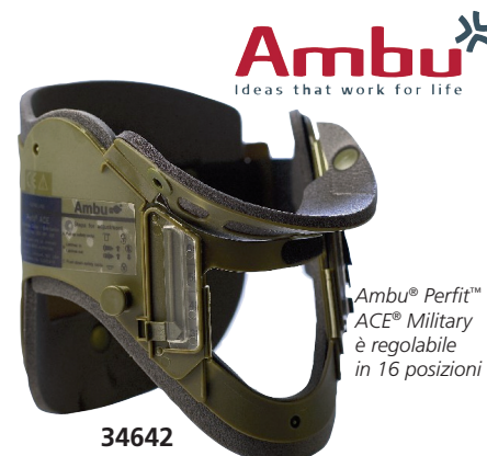
Ambu® Perfit™ ACE® Military è regolabile in 16 posizioni

Il collare Ambu Perfit è un collare rigido per mantenere l'allineamento del collo e per la prevenzione dei movimenti antero posteriori e laterali del collo durante il trasporto e il soccorso al paziente.