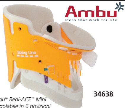
Ambu® Redi-ACE™ Mini è regolabile in 6 posizioni