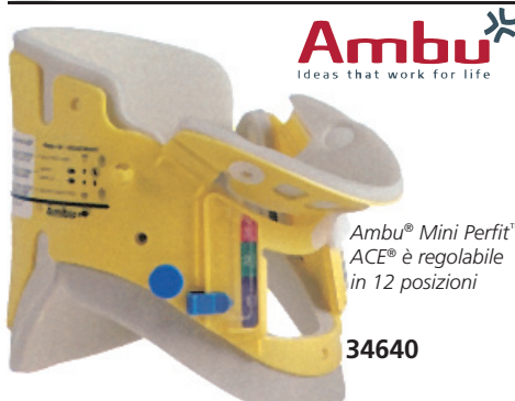
Ambu® Mini Perfit™ ACE® è regolabile in 12 posizioni