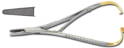
26536 Porta aghi - Mathieu - 14 cm 26537 Porta aghi - Mathieu - 17 cm 26538 Porta aghi - Mathieu - 20 cm