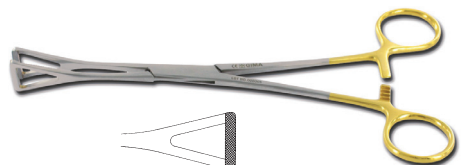
26564 Duval - 20 cm