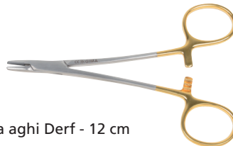
26549 Porta aghi Derf - 12 cm