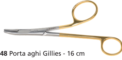
26548 Porta aghi Gillies - 16 cm