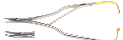
38610 Arruga - retto - 16 cm punte lisce 38611 Arruga - curva - 16 cm punte lisce