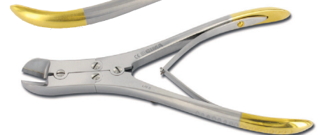
26570 Tronchesino - 14 cm. - per filo morbido 0-1 mm 26571 Tronchesino - 18 cm. - per filo spesso fino a 1,6 mm 26572 Tronchesino - 23 cm. - per filo spesso fino a 2,0 mm