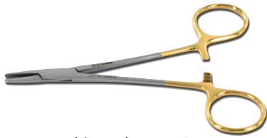
26544 Porta aghi - Webster - 12,5 cm