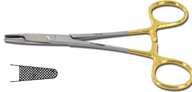
26540 Porta aghi - Olsen Hegar - 14 cm 26541 Porta aghi - Olsen Hegar - 16,5 cm 26542 Porta aghi - Olsen Hegar - 19 cm