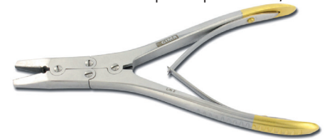
26575 Tieni filo - 18 cm