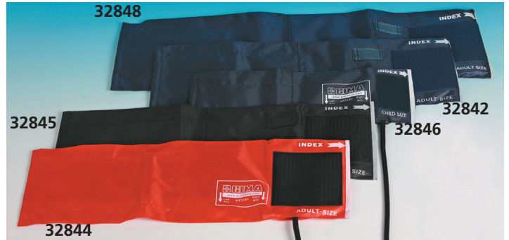
Bracciali in nylon calibrati con polmone in TPU e tubo in PVC