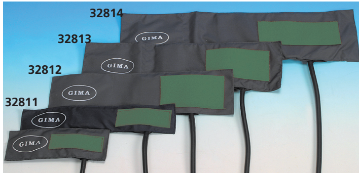
Bracciale in nylon con chiusura velcro, polmone in gomma sintetica. Latex free