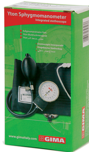
32703 Yton con stetoscopio incorporato