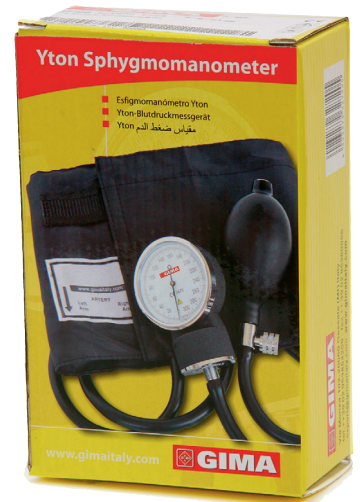
32720 Sfigmomanometro Yton