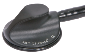
MASTER CLASSIC II BLACK EDITION