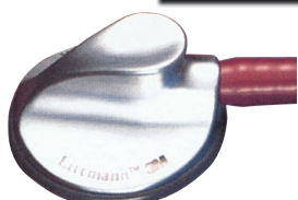
MASTER CLASSIC II

ALTRI COLORI DISPONIBILI SU RICHIESTA IN 20 GIORNI