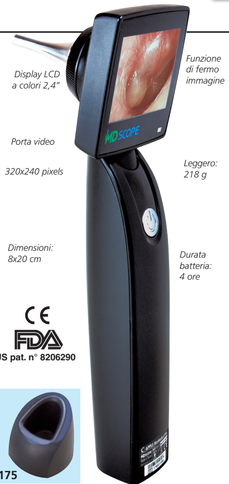
Display LCD a colori 2,4"