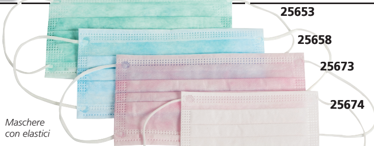
Maschere con elastici