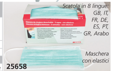
Scatola in 8 lingue: GB, IT, FR, DE, ES, PT, GR, Arabo