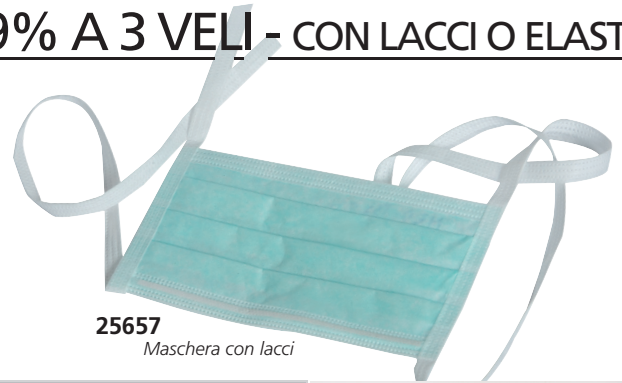
Maschera con lacci