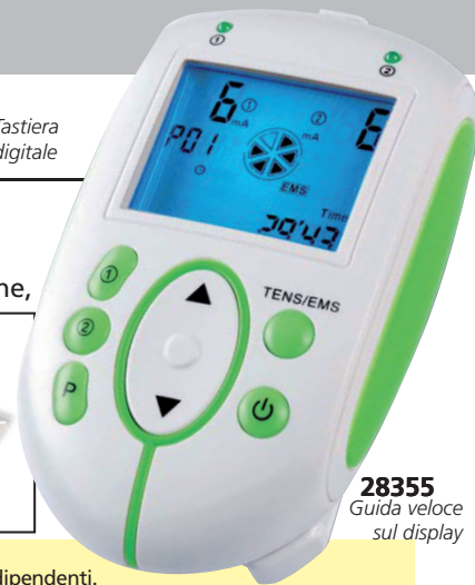
28355 Guida veloce sul display