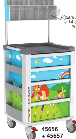
45656 + 45657