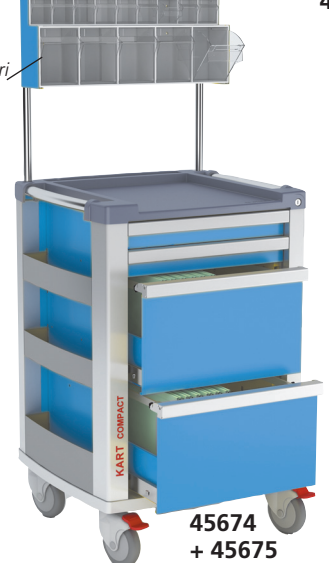
45674 + 45675

45671 VIEWER KART Compact kart con negativoscopio a LED, 2 cassetti piccoli e 2 portacartelle. • 45678 PORTACARTELE SOSPESI*