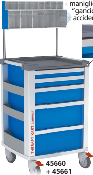
45660 + 45661